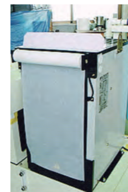
ロール状フィルター (規格品)