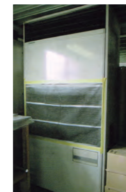
シート状フィルター (カット品) 50枚入り